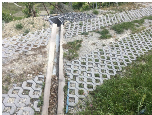
Chemin de Bezé inférieur, traverse, rétention et infiltration

Les eaux de ruissellement sont récupérées par des traverses, dirigées dans une petite rétention puis infiltrées. La législation sur les eaux demande de privilégier l'infiltration des eaux de ruissellement à tout autre mode d'évacuation.