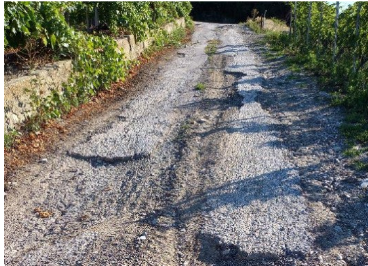
Chemin de Bezé inférieur 'avant'

Le chemin de Bezé inférieur est un chemin secondaire de très forte pente qui était partiellement revêtu d'un enrobé bitumineux. La chaussée de ce chemin était fortement érodée par les eaux de ruissellement.