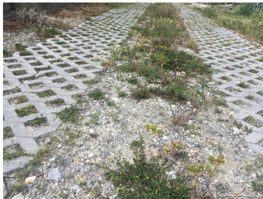
Chemin de Bezé inférieur, bandes de roulement en pavés-gazon et essences adaptées

Afin de remédier à la problématique de l'érosion de la chaussée par les eaux de surface, le chemin a été assaini en réalisant des bandes de roulement en pavés-gazon. Ce revêtement perméable a pour objectif de diminuer la quantité des eaux de ruissellement et d'éviter des concentrations localisées des eaux de ruissellement susceptibles d'endommager la chaussée et/ou le vignoble.